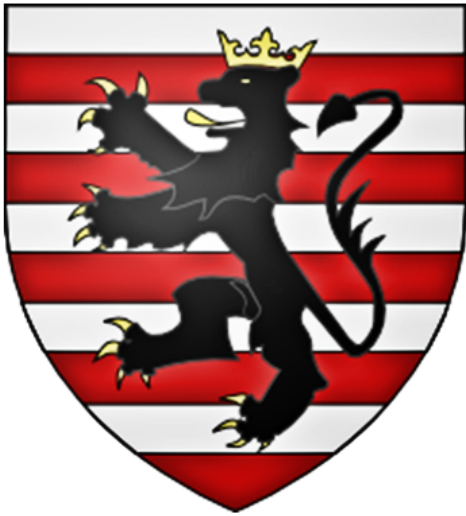
ECU DE LA FAMILLE

En 1106, les Estoutteville possédaient de vastes domaines en Normandie mais résidaient le plus souvent en Angleterre.