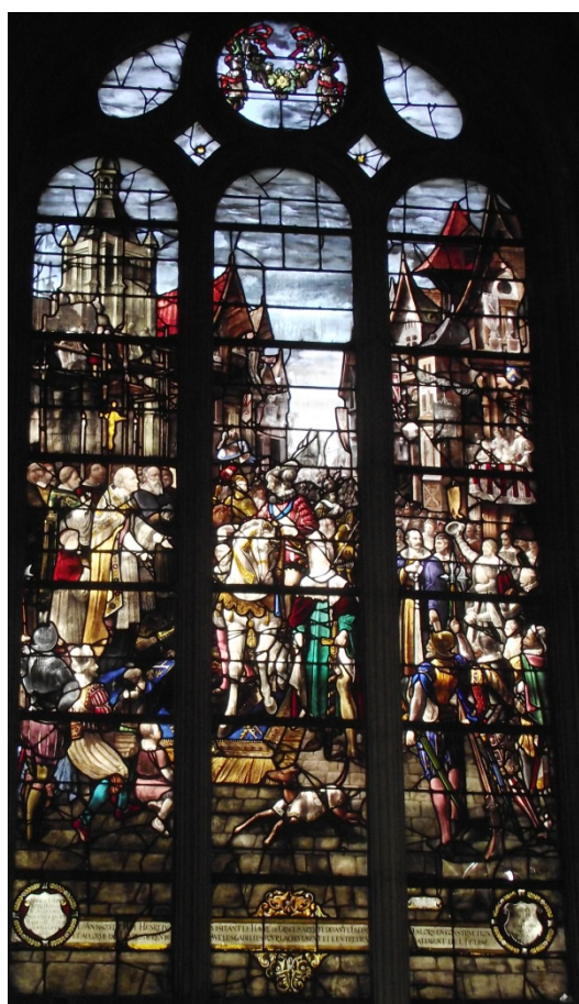
Visite d'Henri IV au Havre