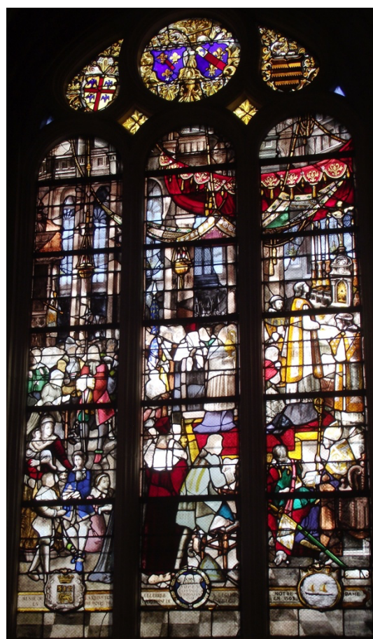
Messe de la réduction célébrée à l'église Notre-Dame en mémoire de la reprise de la ville en 1563