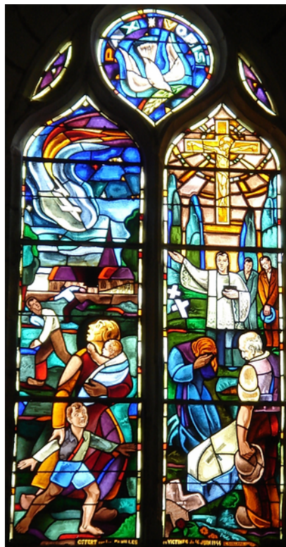
Verrière commémorative moitié du XXe Offerte par les familles des victimes du 16 juin 1944 L. Guillard (Paris) Auppegard