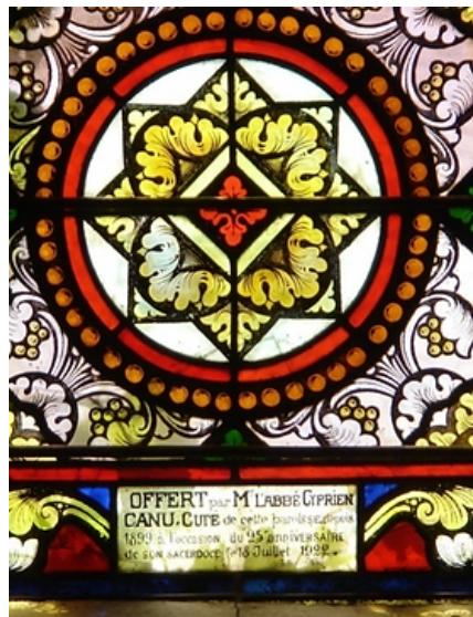
Offert par L'abbé Cyprien Canu, curé de cette paroisse depuis 1899 à l'occasion du 25ème anniversaire de son sacerdoce le 18 juillet 1922 Val de Saane Attribuable à J.B Devisme