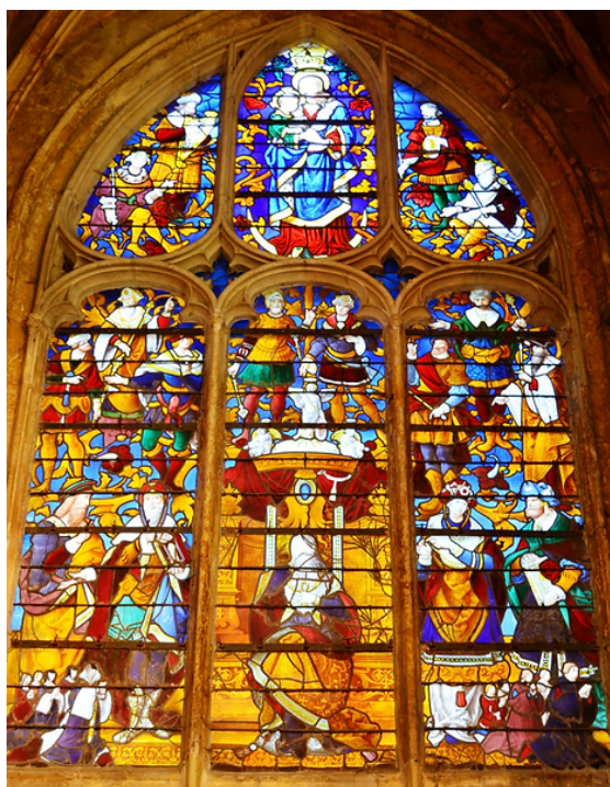
Verrière XIVE Arbre de Jessé Restaurée par You Renaud Caudebec en Caux