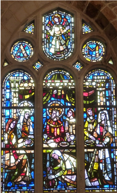
Doudeville - Verrière en dalle de verre et béton Les noces de Cana Verrier Loire Chartres

Si la fonction première des inventaires de l'A.R.S.M. est bien de recenser le patrimoine communal présent dans chaque église, l'exploitation des données recueillies permet de montrer qu'il existe réellement dans le département de Seine-Maritime un trésor patrimonial plutôt sous-estimé qui mériterait d'être mis en valeur.